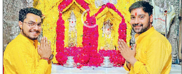
जीद। माता भ्रमरी धाम पुजारी माता की पूजा-अर्चना करते हुए।

शहर के लोगों के आंदोलन की बदौलत हुआ है। लगभग छह महीने के अंदर अंडरपास का निर्माण हो जाएगा। इस अंडरपास से व्यापारियों को काफी लाभ पहुंचेगा तथा पैदल यात्रियों तथा हाथ रहड़ीवालों तथा साइकिल पर जाने वालों बच्चों के लिए संजीवनी बूटी का काम करेगा। टेंडर जारी होने की सूचना से लोगों में नई उमंग चेहरों पर मुस्कान आई है और खासकर व्यापारियों में जो रेलवे फाटक वाला रास्ता बंद होने की वजह से व्यापारियों में रोजीरोटी की चिंता बनी हुई थी।