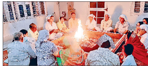
जीद। यज्ञ में आहुति डालते श्रद्धालु।