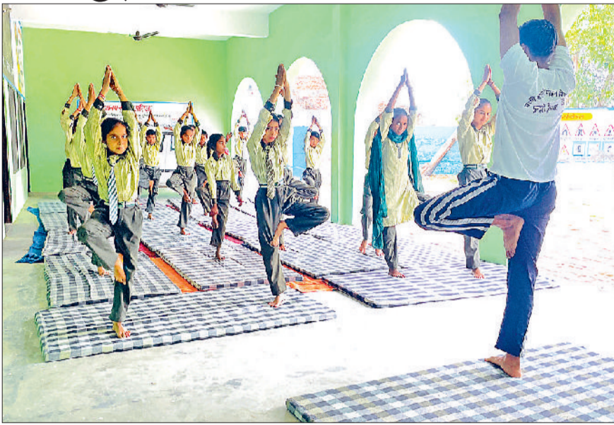
कैथल। योगाभ्यास करते विद्यार्थी।