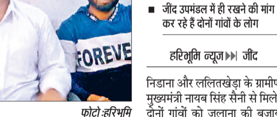
जीद। सीएम से मिलते हुए ग्रामीण।