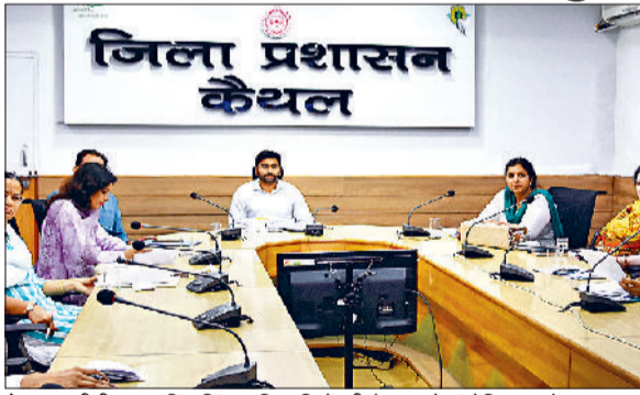
कैथल। सीटीएम गुरविंद सिंह अधिकारियों की बैठक को संबोधित करते हुए।

सीटीएम गुरविंद सिंह वीरवार को राष्ट्रीय बाल अधिकार संरक्षण आयोग के अध्यक्ष की वीडियो कॉन्फ्रेंस के उपरांत संबंधित अधिकारियों को खिला निर्देश दे रहे