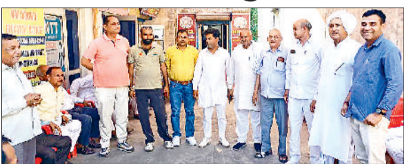
पुंडरी में आयोजित हल्का ब्राह्मण सभा की बैठक में मौजूद पदाधिकारी।