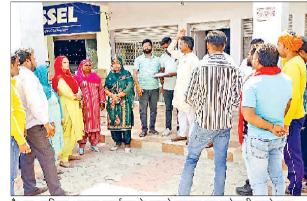
कैथल। पालिका आयुक्त कार्यालय के सामने हड़ताल कर नारेबाजी करते नगर पालिका के कर्मचारी।