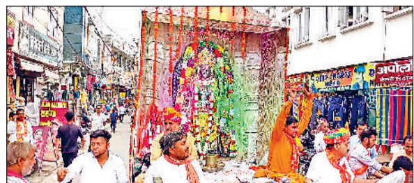
जीद। शोभायात्रा में रामलला का भव्य झांकी।

बुधवार को नरवाना में रामनवमी के शुभ अवसर पर शहर में निकाली गई भव्य शोभायात्रा। यह शोभायात्रा शहर के सनातन धर्म मंदिर से शुरू होकर अपोलो चौक, भगत सिंह चौक, पंजाबी चौक, पटेल नगर, मॉडल टाउन व पतराम नगर की गलियों से होते हुए वापिस सनातन धर्म मंदिर में यात्रा को समापन हुआ। इस दौरान शोभायात्रा में हजारों की संख्या में महिलाएं बच्चों व पुरुषों ने बढ़-चढ़ कर हिस्सा लिया। शोभा यात्रा में काफी संख्या में शिव मां