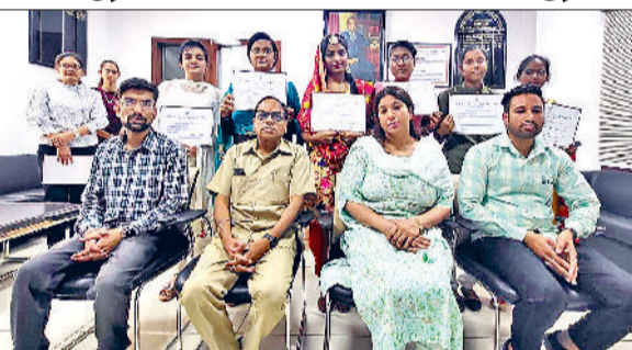
कैथल। बुक रिव्यू में अबल रहे विद्यार्थियों को सम्मानित करते पदाधिकारी।

आरकेएसडी महाविद्यालय के सांध्यकालीन सत्र के अंग्रेजी विभाग द्वारा क्लासरूम एक्टिविटी के अंतर्गत विद्यार्थियों को "बुक रिव्यू" के लिए प्रेरित किया गया। इस कार्यक्रम का विषय एलजाबिथन व जेकोबियन एज रहा जिसके अंतर्गत विद्यार्थियों ने बुक रिव्यू कर बुक पर अपने अपने व्याख्यान प्रस्तुत किए और संबंधित विषय पर उचित जानकारी प्रदान की। इस आयोजन में 35 विद्यार्थियों ने भाग लिया। एम ए इंग्लिश अंतिम