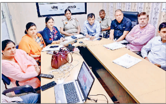
जीद। बाल विवाह रोकने के लिए आयोजित वीसी में भाग लेते अधिकारी।

जिला में किसी भी स्तर में बाल विवाह न होने पाए, इसके लिए तैयारियां शुरू कर दी गई हैं। हालांकि पिछले तीन चार वर्षों की बात की जाए तो लगातार बाल विवाह के मामलों में कमी है। बावजूद इसके जिला महिला संरक्षण एवं बाल विवाह निषेध अधिकारी कार्यालय टीम किसी भी स्तर पर कोर-कसर छोड़ना नहीं चाह रही है। इस बार दस मई को अक्षय तृतीया (अखा तीज) है और जिलाभर में विवाह समारोहों की धूम रहेगी और युवा भी खूब विवाह बंधन में बंधेंगे। ऐसे में अक्षय तृतीया पर होने वाले सामूहिक विवाह का आड़ में कुछ बाल विवाह भी हो सकते हैं। जिसके चलते जिला महिला संरक्षण एवं बाल विवाह निषेध अधिकारी कार्यालय टीम की विशेष नजर रहेगी। इन्होंने लड़के की आयु 21 वर्ष से कम तथा लड़की की आयु 18 वर्ष की आयु से कम पाई जाती है तो कानूनी कार्रवाई अमल में लाई जाएगी। इसके साथ-साथ अब बाल विवाह के केस में पोक्सो एक्ट का केस दर्ज करवाने का प्रावधान भी कर दिया गया है।