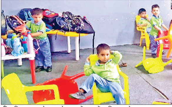
जीद। बिना मान्यता के चल रहे स्कूल में कक्षा में उपस्थित बच्चे।

स्कूल का रजिस्ट्रेशन भी नहीं था। ना ही किसी भी विभाग से अपूर्व ली गई थी, जो स्कूल संचालन के लिए जरूरी होती है। सीएम फ्लाईंग ने विस्तृत रिपोर्ट बना कर मुख्यालय को भेज दी है। शिक्षा विभाग ने स्कूल संचालक को नोटिस जारी किया है। आगामी कार्रवाई शिक्षा विभाग द्वारा अमल